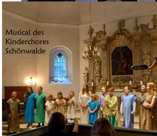
Musical des Kinderchores Schönwalde