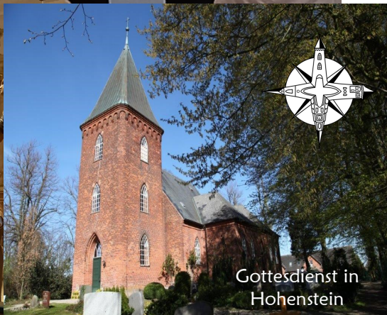
Gottesdienst in Hohenstein