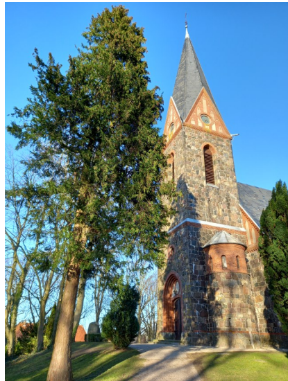
Christus- kirche zu Hansühn