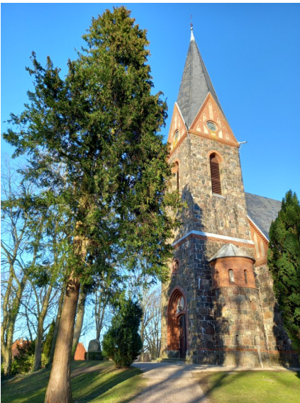
Christuskirche zu Hansühn