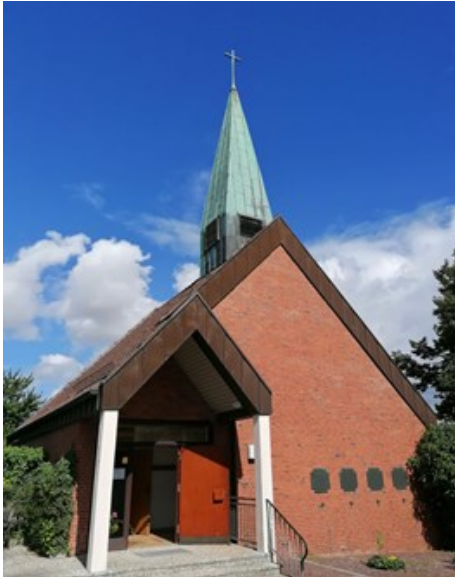
Kapelle in Harmsdorf

Wir suchen für den Küsterdienst in der St. Johanneskapelle in Harmsdorf zu sofort oder später auf Minijob-Basis eine/n